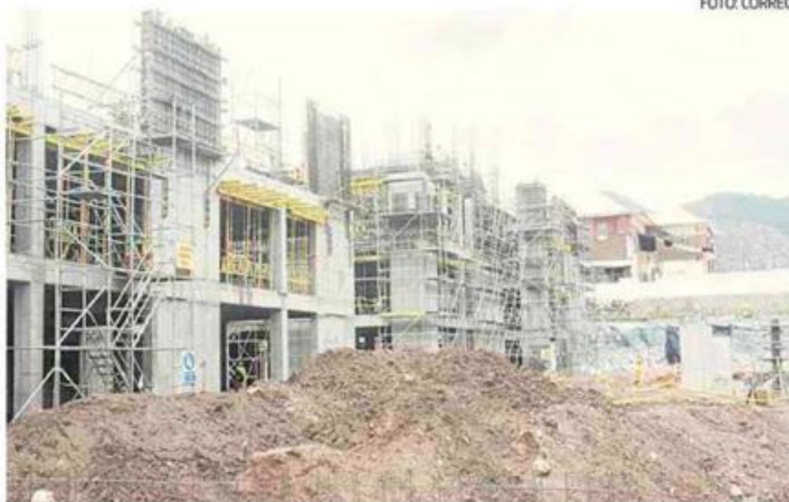
GRC podría pagar más de 220 millones de soles

supuesto de obra de S/. 191'544, 336.58 millones a S/. 204'697, 509.82; monto superior a su propuesta económica y contrato suscrito. El GRC llegaría a pagar S/. 13'153,148.24 millones de más al monto primigenio que se suscribió en el contrato N° 239 -2012 -GR Cusco/GGR con el