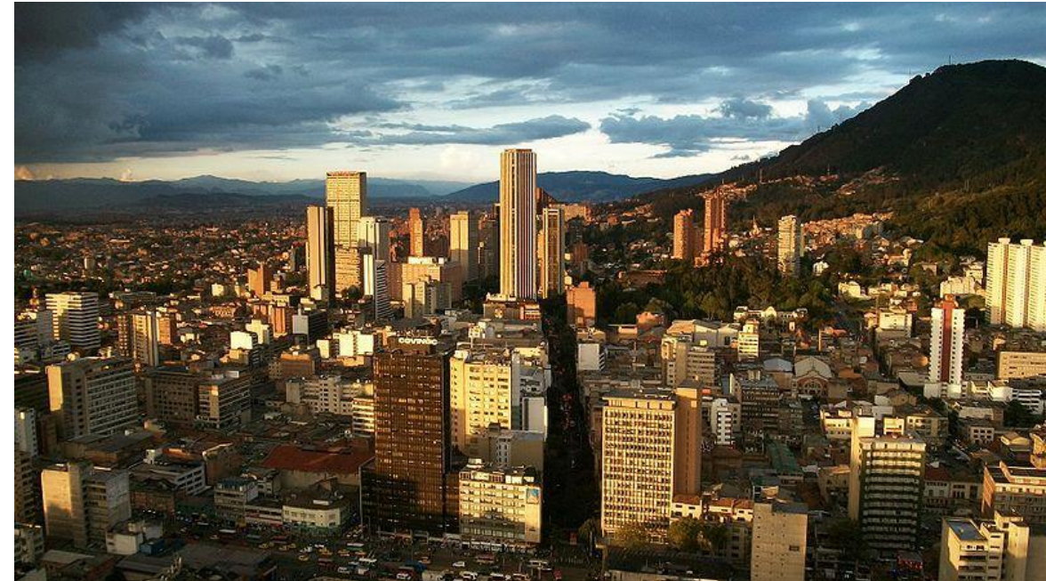
Vista panorámica de Bogotá, Colombia