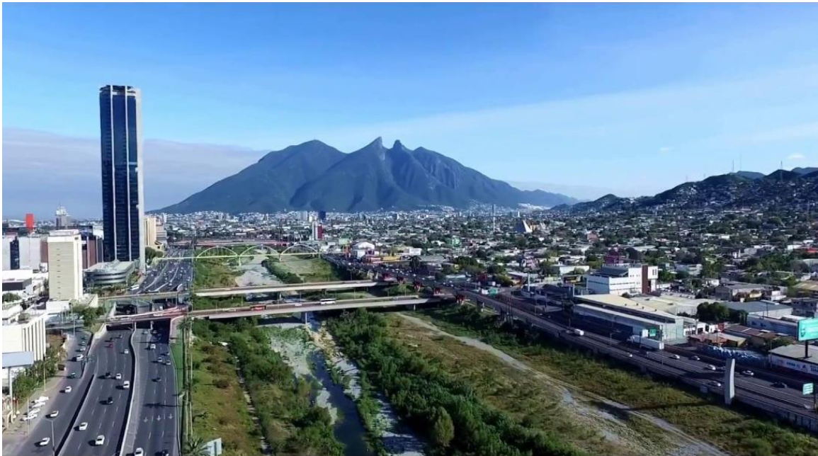
Vista panorámica de Monterrey, México